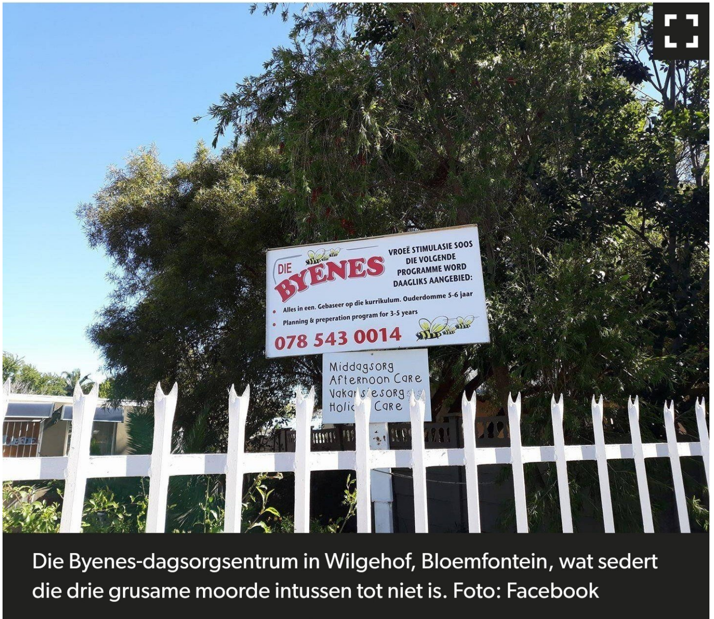
Die Byenes-dagsorgsentrum in Wilgehof, Bloemfontein, wat sedert die drie grusame moorde intussen tot niet is.

Die Woensdagaand, 28 Junie 2023 – die einde van die maand toe ouers hul skoolgelde vir hul kinders moes betaal – het ouers die aand om 23:07 'n boodskap op WhatsApp gekry wat glo van Janine of Bets sou gekom en van een van hulle se selfone gestuur is. Die boodskap het gelui: "Hy everyone sorry for disturbing you . . .Tommorow no sochool until i get back to you."